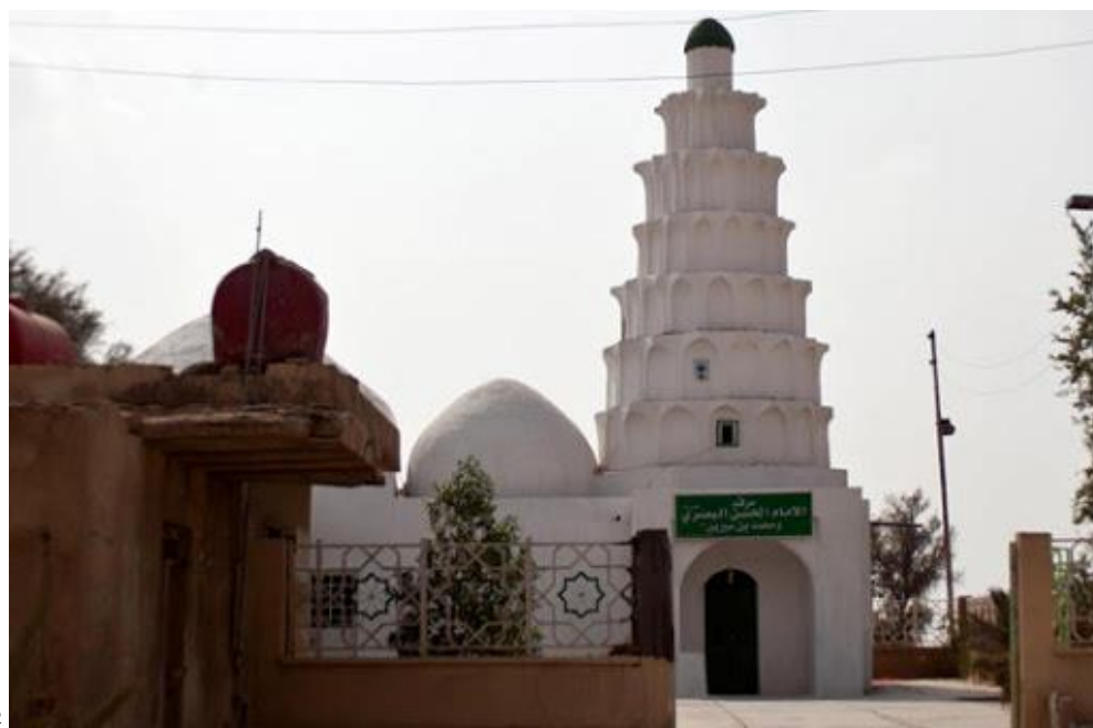
2 Тюрбето на големеца на Табиин – Хасен-и Басри “куддесе сиррух”

Бащата на Хасен-и Басри бе от Басра. Беше известен с имената Фируз и Йесар. Когато стана мюсюлманин, прие името Джафер. Беше пленен, когато ислямските армии бяха отишли да завземат Мейсан, и стана роб на Зейд бин Сабит ел-Енсари. Майката на Хасен-и Басри пък – Хайре Хатун – бе прислужница на Умму Селеме “радияллаху анха”, една от благословените жени на Пейгамбера ни “салляллаху алейхи ве селлем”. Йесар и Хайре се ожениха преди да приемат исляма. През 641 (21) г. – по време на управлението на хазрети Омер – от този брак се роди Хасен-и Басри. За берекет го отведоха при хазрети Омер да му сложи име. Когато Омер “радияллаху анх” видя прекрасното му лице, рече: “Нека бъде Хасен (красив).”